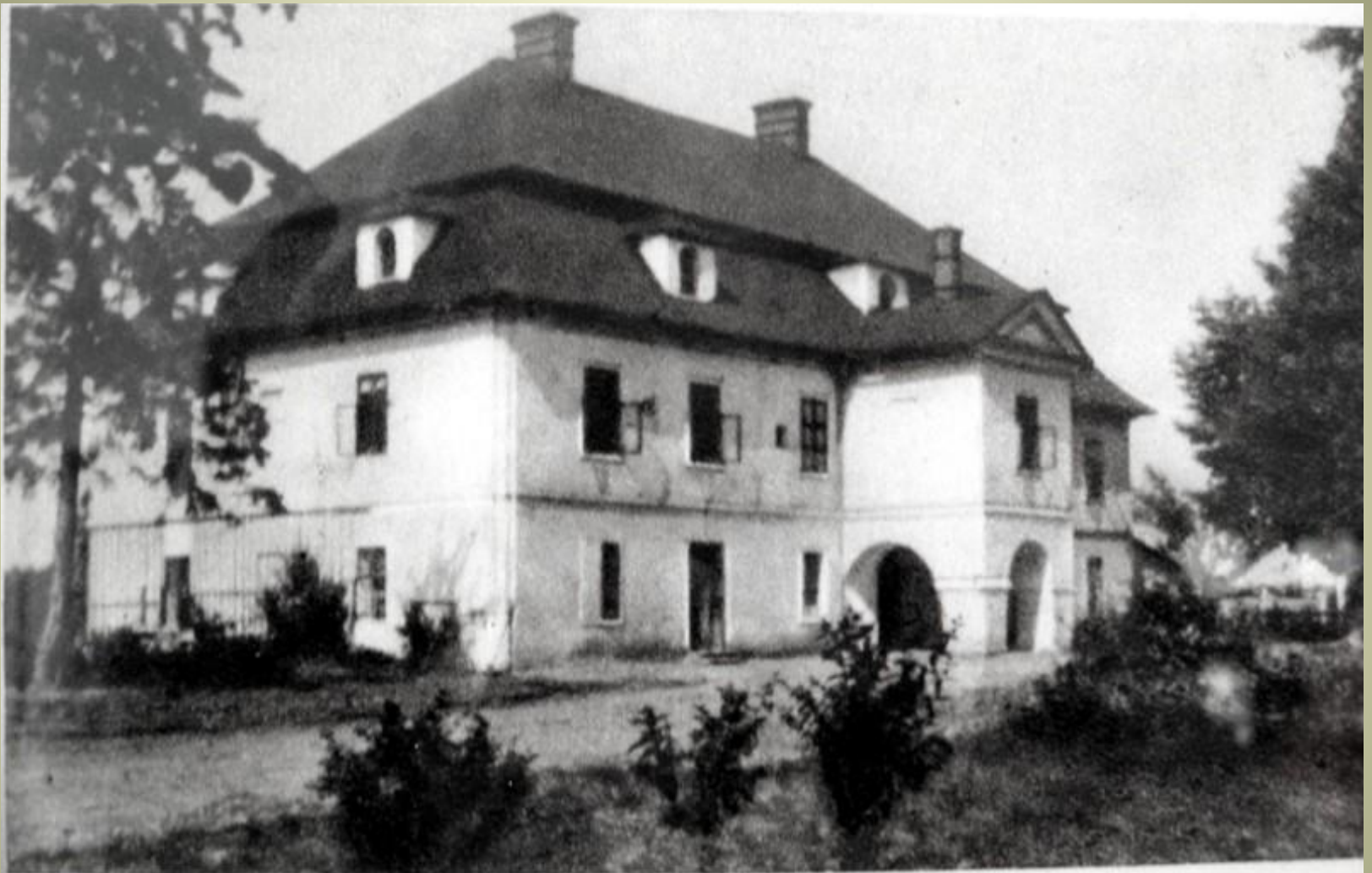
Dwór ziemiański w Górkach Wielkich