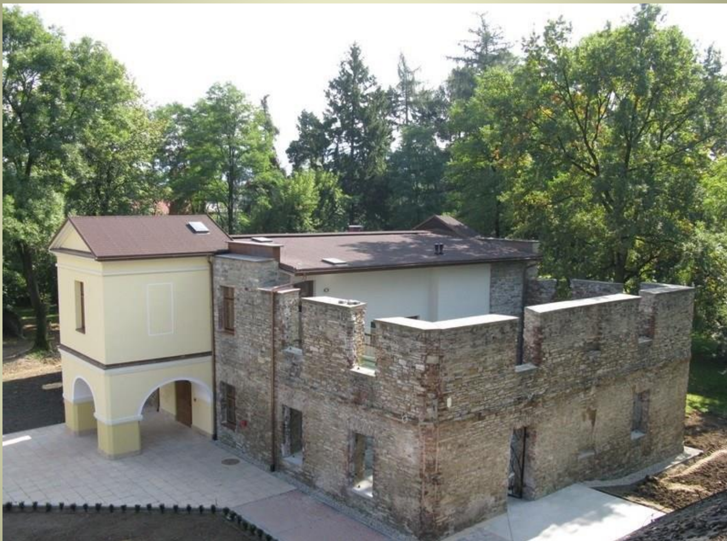
Ruiny dworu Kossaków w Górkach Wielkich – widok z góry. Obecnie siedziba fundacji www.muzeumkossak.pl